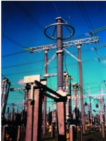
330 kV afleder med silikoneisolering