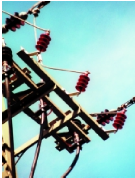
24 kV afleder med silikoneisolering